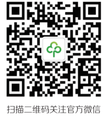
扫描二维码关注官方微信