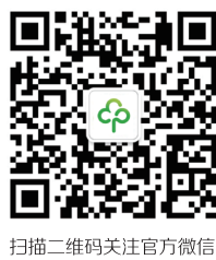
扫描二维码关注官方微信