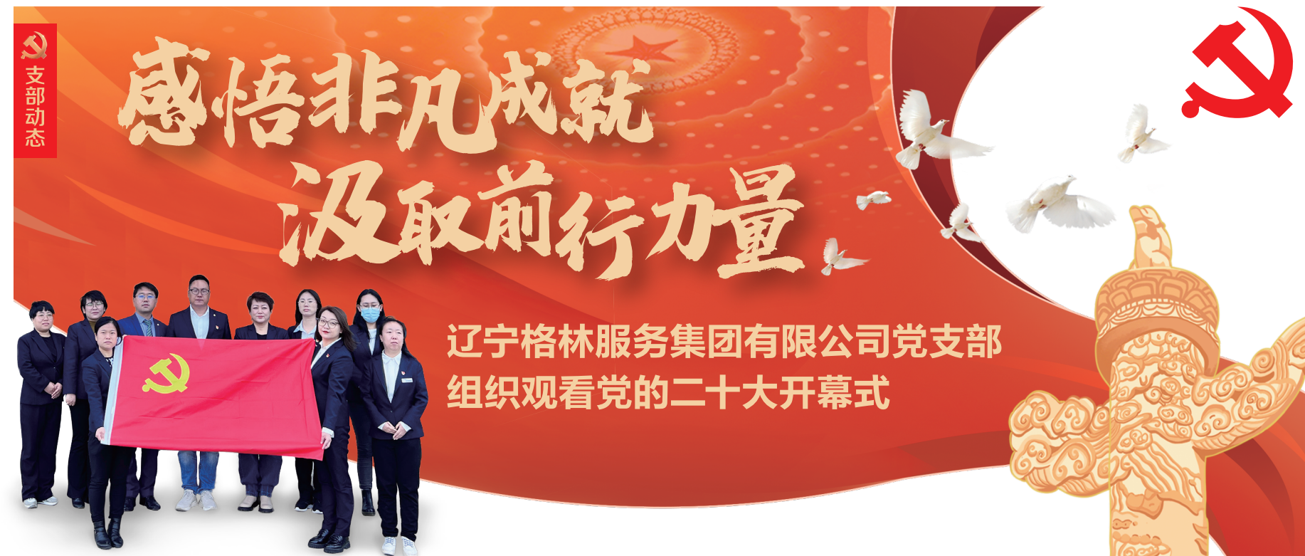
辽宁格林服务集团有限公司党支部组织观看党的二十大开幕式

主办单位 / 中国共产党辽宁格林豪森服务集团有限公司支部委员会 主编 / 陈晓波 文字编辑 / 夏爽、陈新 美术编辑 / 杨诗华、牛静怡