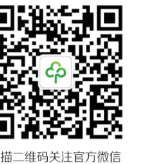
扫描二维码关注官方微信