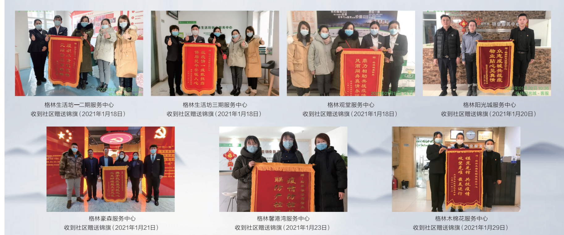
格林生活坊一二期服务中心 收到社区赠送锦旗 (2021年1月18日) 格林生活坊三期服务中心 收到社区赠送锦旗 (2021年1月18日) 格林观堂服务中心 收到社区赠送锦旗 (2021年1月18日) 格林阳光城服务中心 收到社区赠送锦旗 (2021年1月20日) 格林豪森服务中心 收到社区赠送锦旗 (2021年1月21日) 格林馨港湾服务中心 收到社区赠送锦旗 (2021年1月23日) 格林木棉花服务中心 收到社区赠送锦旗 (2021年1月29日)

格林豪森服务会响应政府号召, 与各社区及政府部门齐心协力、相伴同行, 全力打赢没有硝烟的防疫阻击战, 坚持党建引领物业服务工作, 落实‘建三联’物业服务体系, 更好地为业主奉献卓越服务, 塑造格林豪森经典品牌。